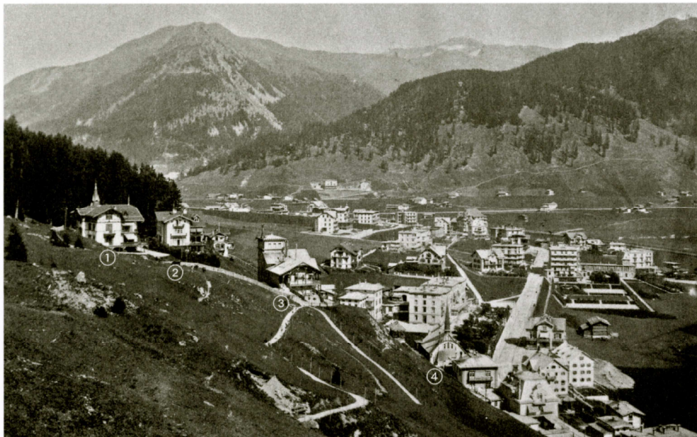
Englisch Viertel 1905: ① Oberhof ② Waldfriede ③ Villa am Stein ④ Englische Kirche.