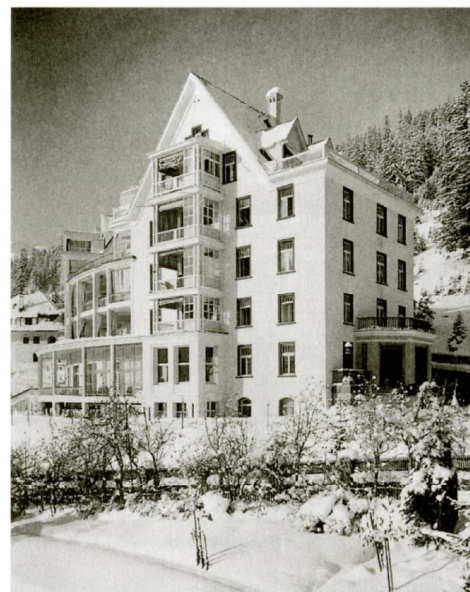
Vom Waldsanatorium (1911) zum Waldhotel von heute.

Bis 1957 steht das Waldsanatorium Tuberkulosekranken offen. Wegen der neuen wirksamen