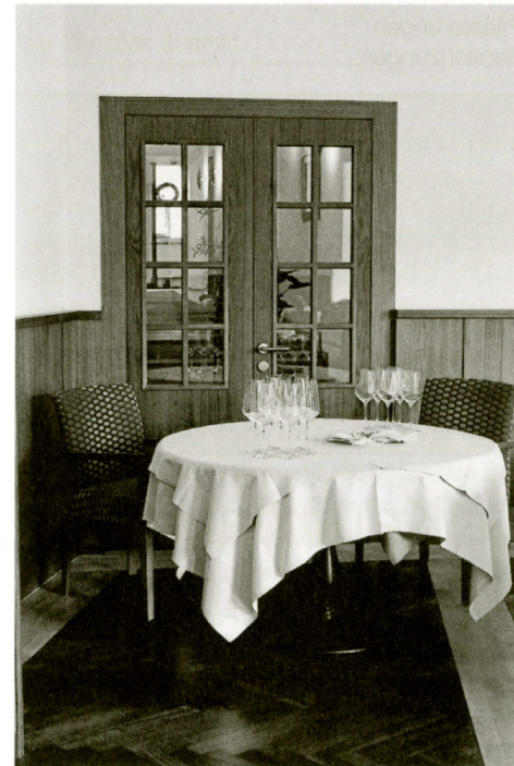
Wohl die berühmteste Türe der Weltliteratur.