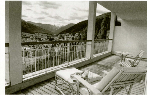
Liegebalkone mit originalem Geländer.

bildeten Balkongitter in die Davoser Bergwelt. Für die Innenausstattung wurden erlesene Materialien wie Nussbaum und Ahorn für die Parkettböden und grauer Valser Quarzit verwendet. Vor dem wieder frei gelegten alten Kamin mit schwarzer Marmorabdeckung kann man sich in nachgebauten Originalsesseln unter Jugendstilleuchtern dem Träumen hingeben. Im Speisesaal wurde die ursprüngliche Kassettendecke restauriert. Selbst die Tür, «die die (im «Zauberberg») verspätet zur Mahlzeit erscheinende Madame Chauchat jeweils nachlässig ins Schloss fallen liess», blieb erhalten. ... Eine Tür war zugefallen, es war die Tür links vorn, die gleich in die Halle führte, – jemand hatte sie zufallen lassen oder gar hinter sich ins Schloss geworfen, und das war ein Geräusch, das Hans Castorp auf den Tod nicht leiden konnte, das er von jeher gehasst hatte... So