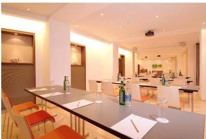
AURA I + II